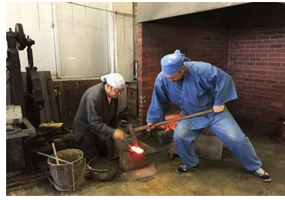
奥出云地区刀剑鍛造技艺演示