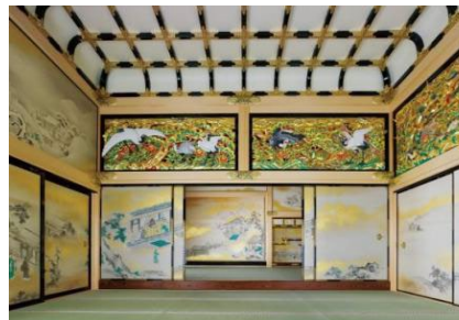
名古屋城本丸御殿内部