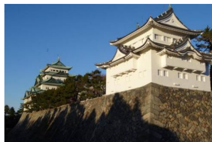
名古屋城西南隅櫓